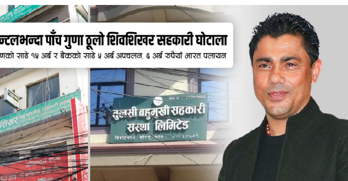
ओरियन्टलभन्दा पाँच गुणा ठूलो शिवशिखर सहकारी घोटाला सर्वसाधारणको साथै १५ अर्ब र बैंकको साथै ५ अर्ब अपचलन, ६ अर्ब रूपैयाँ भारत पलायन

माछापुच्छ्रे बैंकले २ वटा उद्योगमा करिब ६८ करोड लगानी गरेको छ । जसमध्ये मोरङको शनिश्चरेमा रहेको गोर्खा टी स्टेट अहिले पनि सञ्चालनमा छ । त्यसको कर्जा निर्वामित भए पनि माछापुच्छ्रे बैंकले लगानी गरेको अर्को एक परियोजना बन्द छ । जसमा करिब ४८ करोड कर्जा लगानी रहेको स्रोतले बतायो । त्यस्तै, उनको कम्पनीमा प्रभु बैंकको पनि ३५ देखि ४० करोड रूपैयाँ लगानी रहेको स्रोतको भनाइ छ । यसबाहेक एनएमबी बैंकले पनि करिब ८ करोड कर्जा लगानी गरेको स्रोतले